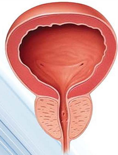
enlarged prostate gland